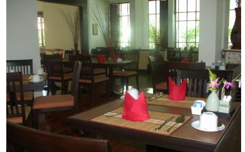
トン・タラ・レストラン