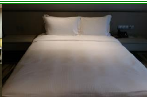
スーペリアルーム