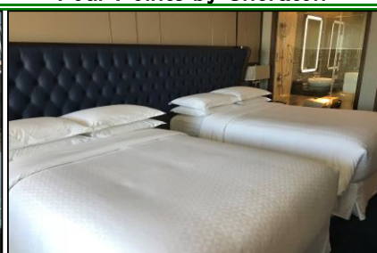
スーペリアツイン