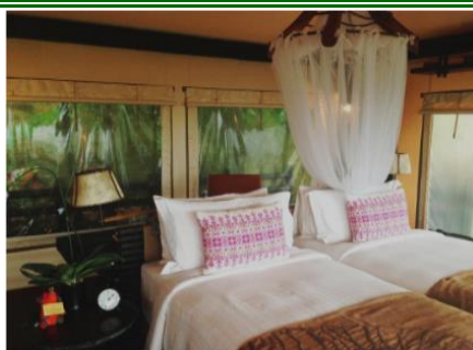
ツインベディッドテント