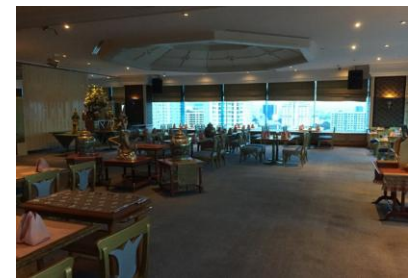
24階のタイレストラン