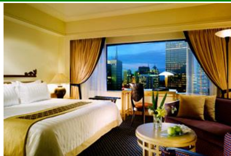
スーパリアルーム