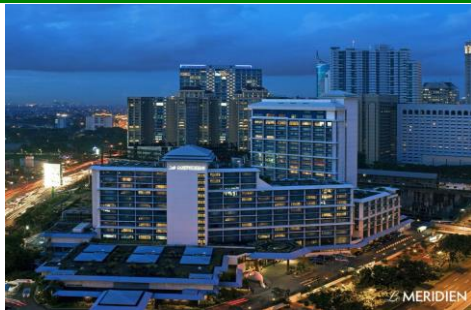
外観(メインタワー)