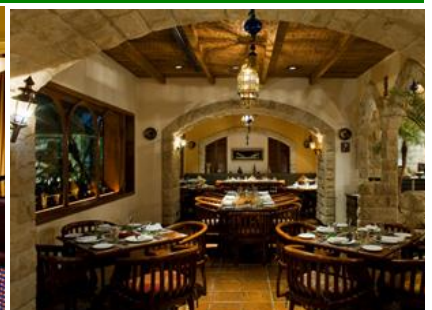
アル ナフォーラレストラン