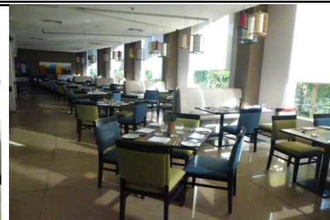
マーケットレストラン