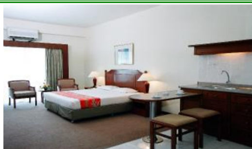
デラックススตูディオ