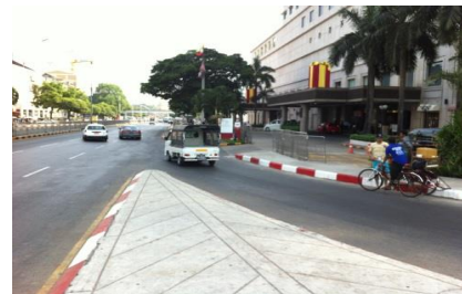
ホテル前道路状況