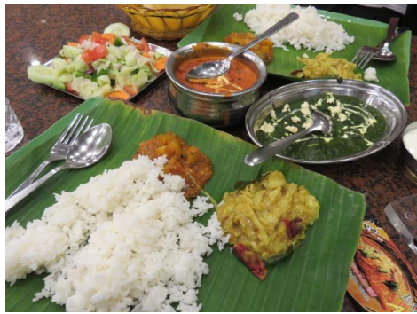
お食事内容(イメージ)